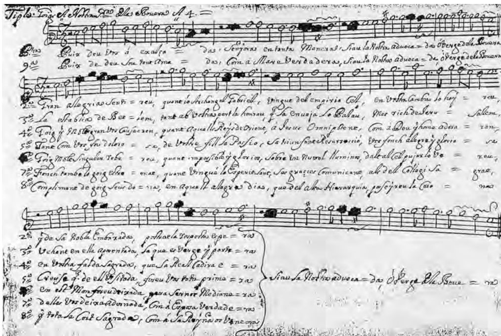
Fig. 3. Particel·la de la part del Tiple.