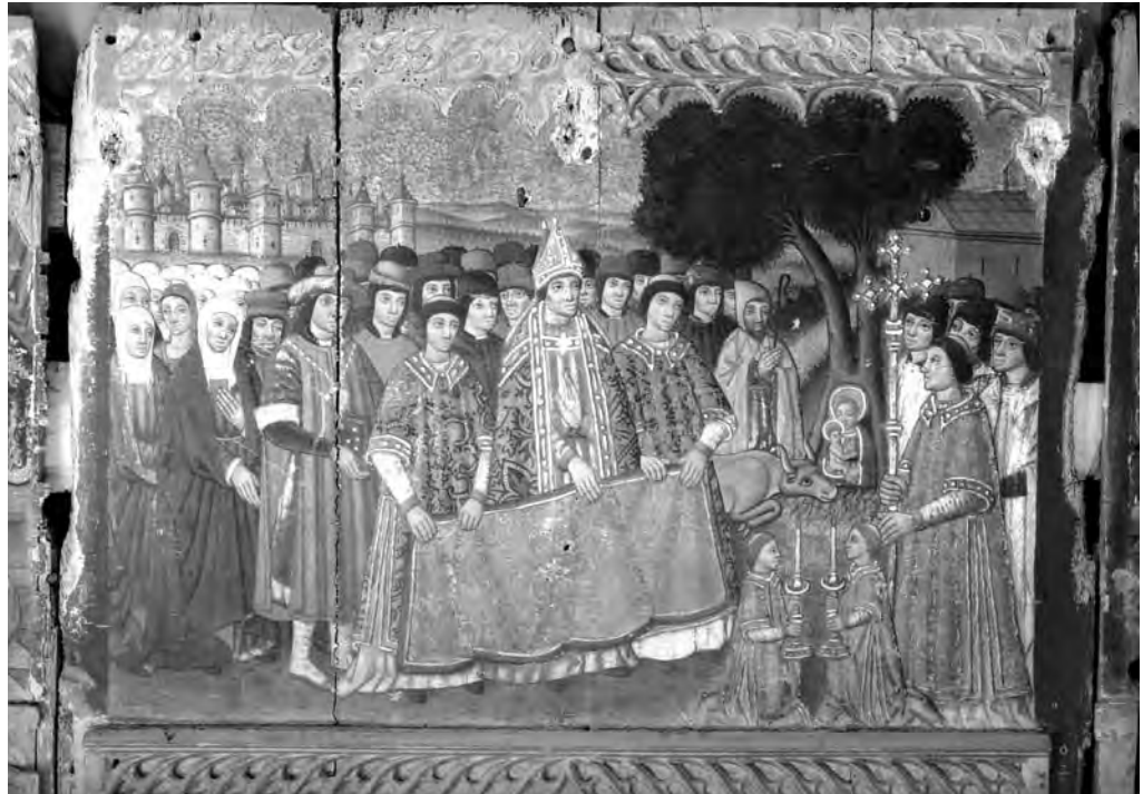
Fig. 7. Taula del retaule de la Bovera referent a la troballa de la Mare de Déu.