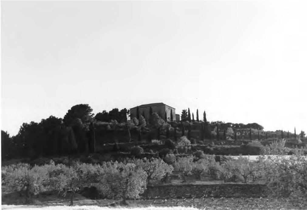
Fig. 1. Santuari de la Mare de Déu de la Bovera.

aspectes que envoltaren aquesta i la seva interpretació, dono a conèixer una part dels manuscrits originals, també en presento la transcripció dels goigs a notació actual, i les dues edicions dels goigs corresponents al 1750 i 1791. Posteriorment se'n feren d'altres edicions però aquestes surten fora de la intenció del treball. 4 A més de donar a conèixer l'existència dels goigs de 1721, la seva música i el seu text, també en descriu breument certs aspectes musicals que l'anàlisi de la partitura ens poden desvetllar, i en comento alguns trets que, tot i la brevetat de l'obra, ens aporten dades de com eren les capelles musicals de primers del segle XVIII a les nostres terres.