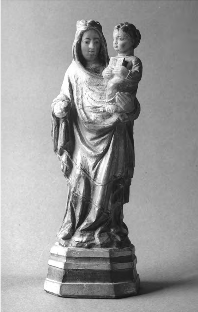
Fig. 2. Imatge de la Mare de Déu de la Bovera.

En general els goigs solen tenir unes estructures literàries que els són comunes, com ara, els sis versos en què se solen dividir cadascuna de les estrofes o cobles. Aquests versos es componen generalment d'una mètrica heptasil·làbica amb rima consonant, molt utilitzada en la cançó popular i tradicional i també molt emprada en la poesia trobadoresca dels segles XII i XIII. La rima sol ser senzilla amb versos curts sense cesura, és consonant i sovint els quatre primers versos presenten en la forma a b b a , o també a b a b . El cinquè i sisè versos adopten una rima variable com ara a a, c c, c a o també, c d . Si aquests dos últims versos els unim amb els dos del recoble que es va repetint després de cada estrofa en po-