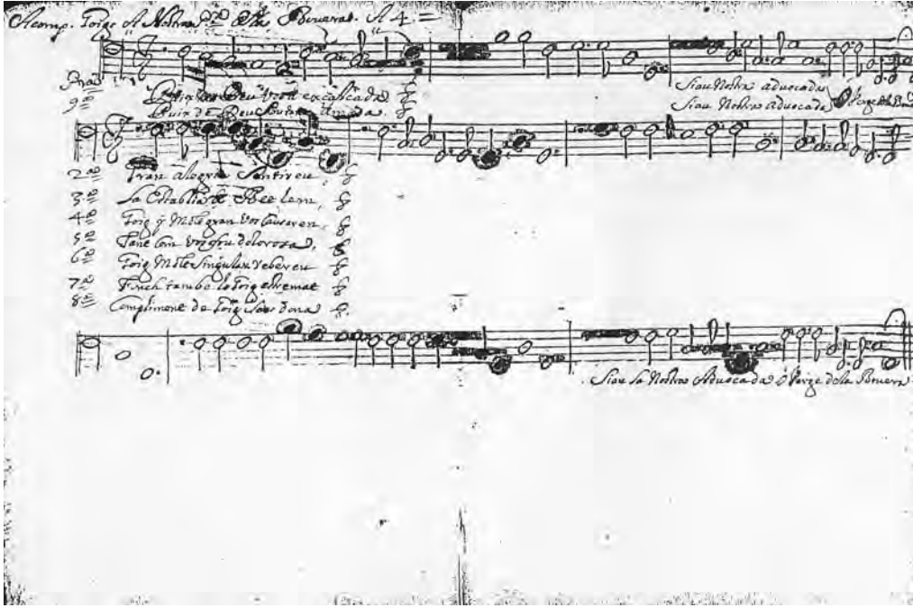
Fig. 4. Particel·la de la part de l'Acompañamiento.

terior a la mort de dit mossèn. Gairebé la totalitat de les obres que conformen el Fons Verdú duen aquesta afirmació. Possiblement aquest fet deu ser degut a que en el seu moment es tractaria de fer una mena d'inventari ja que algunes de les obres, a més, duen un número de catalogació i totes contenen escri-