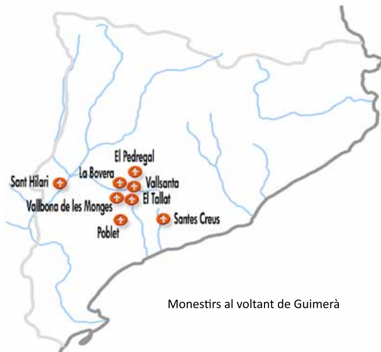
Monestirs al voltant de Guimerà