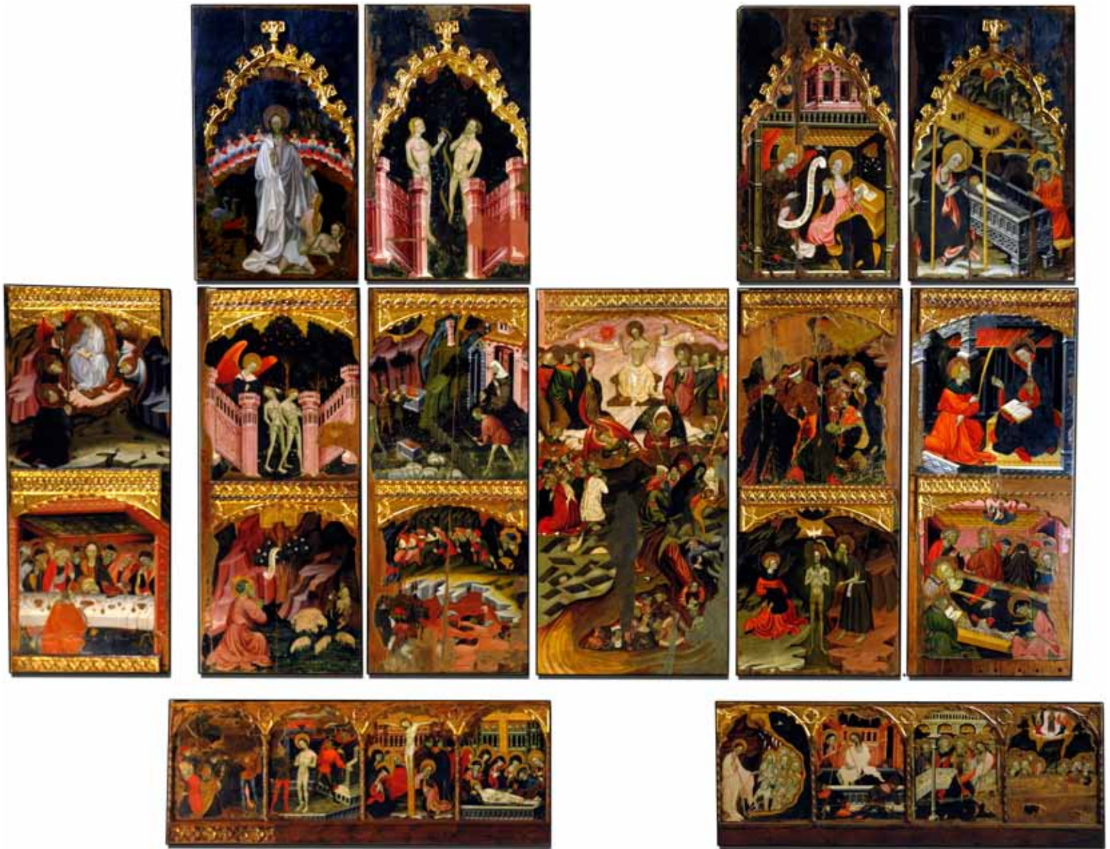
El Retable de Guimerà de Ramon de Mur tal i com està exposat al Museu Episcopal de Vic amb les taules agrupades per facilitar la seva visió