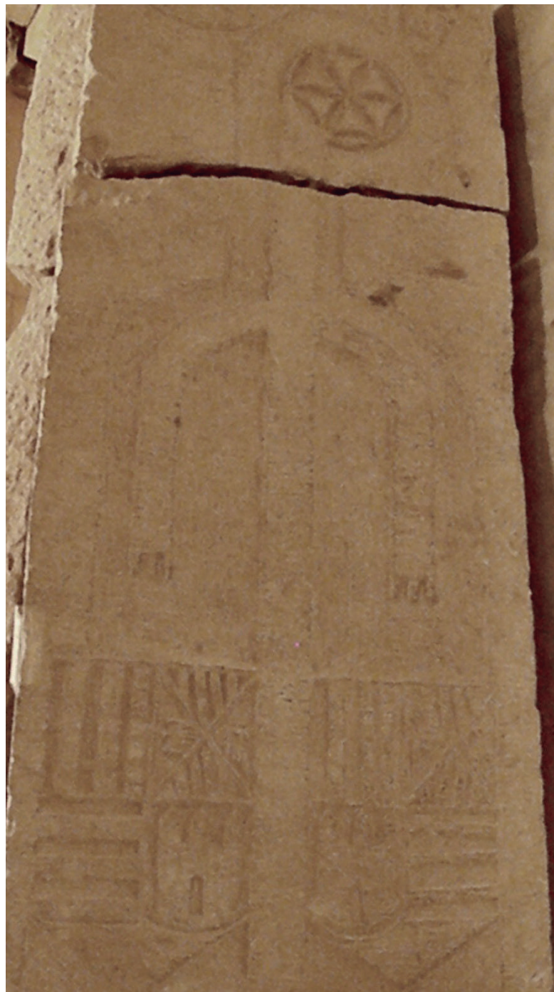
Imatge-4: Lauda d'Aldonça de Castre i Alemany, 1404.