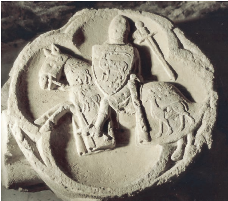
Imatge-2: Clau de volta amb cavaller militar, Bernat de Boixadors.