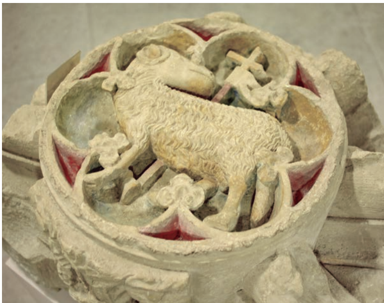
Imatge-3: Agnus Dei . Dues temàtiques completament diferents manifestades a Vallsanta: el poder espiritual i el poder reial.