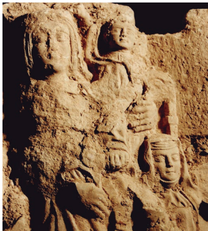
Imatge-1: Clau de volta amb l' Agnus Dei . Al seu lateral, la imatge de la MaredeDéu amb el nen, acompanyada d'una abadessa i un abat —també pot representar a Sant Bernat?