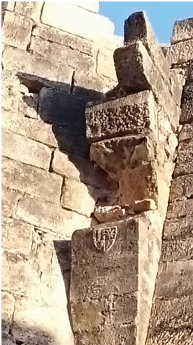
Imatge-5: Escut dels Castre i Alemany en l'arrencada del reforç de l'arc diafragmàtic de l'absis. Obres de 1371.