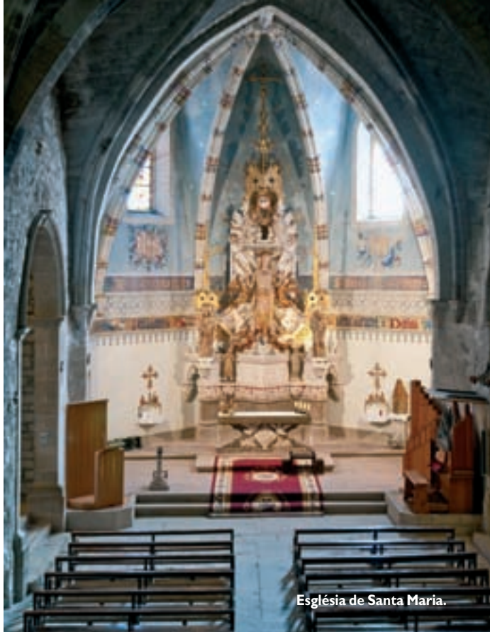
Església de Santa Maria.