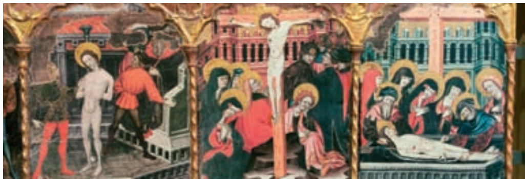
Detalls de l'església de Santa Maria, entre els quals el sagrari, obra de l'artista Josep Maria Jujol, i una part del magnífic retaule de Guimerà, de Ramon de Mur.