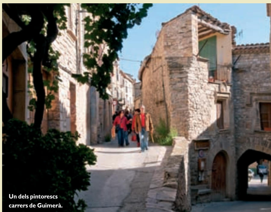
Un dels pintorescs carrers de Guimerà.

Renacimiento cerró la etapa medieval. En Guimerà se conservan muestras de esta época artística en los ventanales de tres fachadas: en la casa particular de Cal Minguella; en el edificio de Cal Manseta, y en la Cor del Batlle, que actualmente alberga el Museo de Guimerà (donde se exhiben los descubrimientos más importantes de las excavaciones de Vallsanta, hechas en 2008 y 2009, y donde hay una exposición didáctica sobre Tierra de Monasterios). El Museo se está confirmando como punto y oficina de información y también es la sede del proyecto de internet, que pretende dar a conocer Guimerà a