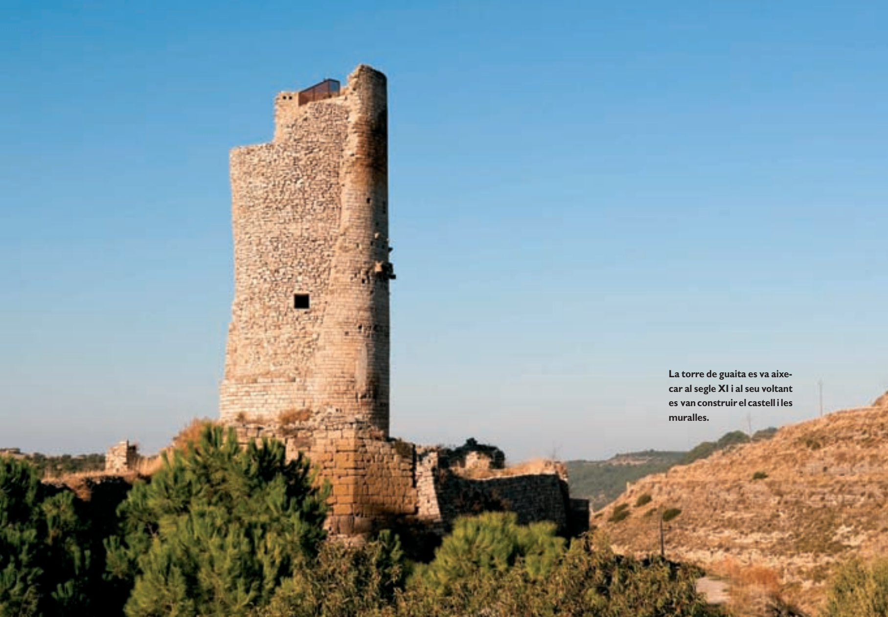
La torre de guaita es va aixecar al segle XI i al seu voltant es van construir el castell i les muralles.

dia, de dimecres a dimarts, perquè no coincidís amb el de Verdú. Aquests permisos evidenciaven la influència i els contactes que tenien els senyors de Guimerà. Avui dia, a iniciativa dels mateixos guimeranencs, s'ha recuperat l'esplendor d'aquest mercat medieval com a celebració festiva que recorda aquesta època i el que va significar per a la vila. No obstant això, l'ascendència de Guimerà cal buscar-la al baix imperi romà, d'arrels germàniques. I és en aquest punt que també cal fixar-se en el pas de les diferents civilitzacions anteriors per aquesta regió, perquè en els períodes de la història antiga és des d'on s'inicia aquest recorregut pel passat.