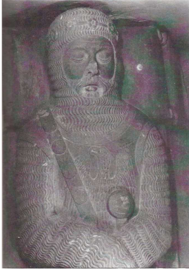
Fig. 3. Figura jacent d'un Aguiló. Sepulcre de l'església de Talavera, obra de Guillem Seguer.

És precisament el contrast entre el jacent de Bernat de Boixadors i el d'un membre de la família Aguiló en aquest darrer indret (fig. 3) el que evidencia la pertinença d'ambdues figures a un únic escultor. Si bé poden existir lleugeres diferències qualitatives, el tractament escultòric de l'un i de l'altre és comú. Es molt reveladora, per exemple, la solució adoptada als ulls; les parpelles s'han resolt d'acord amb el que esdevé un dels estilemes més característics de Guillem Seguer: dibuix minuciós dels elements pilosos. I no solament això. fins i tot són reveladores en aquesta aproximació que proposem les coincidències en el tipus d'arnès que vesteixen ambdues figures. Duen cota de malles, capmall i perpunt superior. Mentre en el cas de l'Aguiló l'heràldica ocupa totalment la zona frontal del jaqués, en el cas del Boixadors s'ha reproduït sobre aquest una d'aquelles plaques metàl·liques esmaltades usuals com a ornament de la indumentària cavalleresca. Si es comparen la disposició general del cos i els components de l'arnès militar, les coincidències continuen. Duen ambdós espasa i punyal, si bé en el cas del de Vallsanta s'aprecia una major sumptuositat en l'acabat d'aquestes peces. La beina de l'altre molt més ornamentada i el mateix succeeix amb les creueres d'aquesta i de la daga. Als peus de Bernat de Boixadors hi ha un llebrer, amb un collaret de cascavells al coll, rosegant un os, particularitat que també és al sepulcre de Talavera.