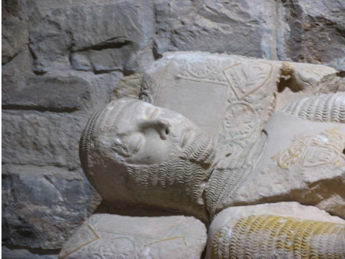
Fotografies de la figura jacent