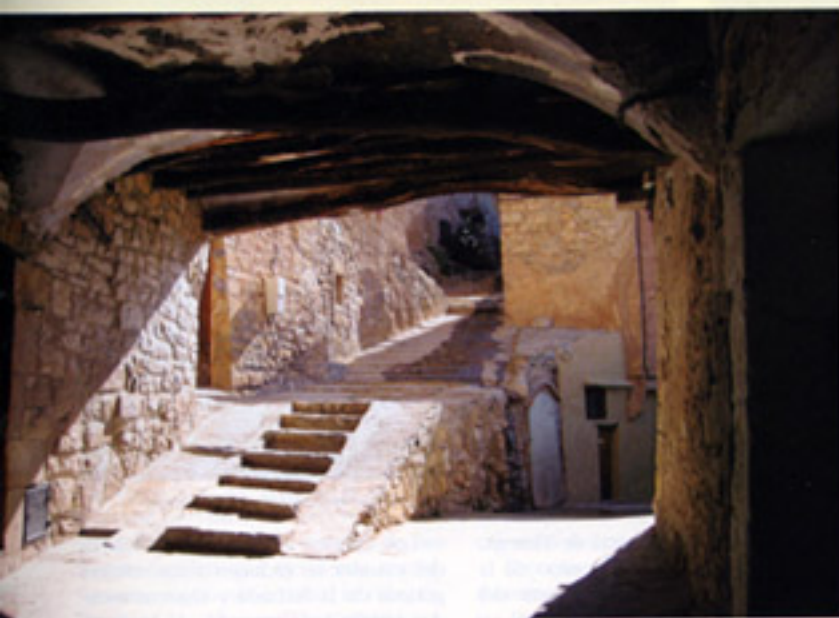
Las calles de Guimerà constituyen una sucesión de pasadizos, cubiertos y soportales.

calle inferior, y otro por la buhardilla, que sale a la calle superior.