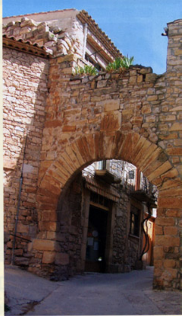
Arriba, la iglesia. A la derecha, el portal de Tárrega. Debajo, un detalle del Sagrari de Josep Maria Jujol.

por los arqueólogos han situado los restos más antiguos del castillo entre los siglos X y XI, cuando la villa de Guimerà ostentaba ya cierta relevancia.