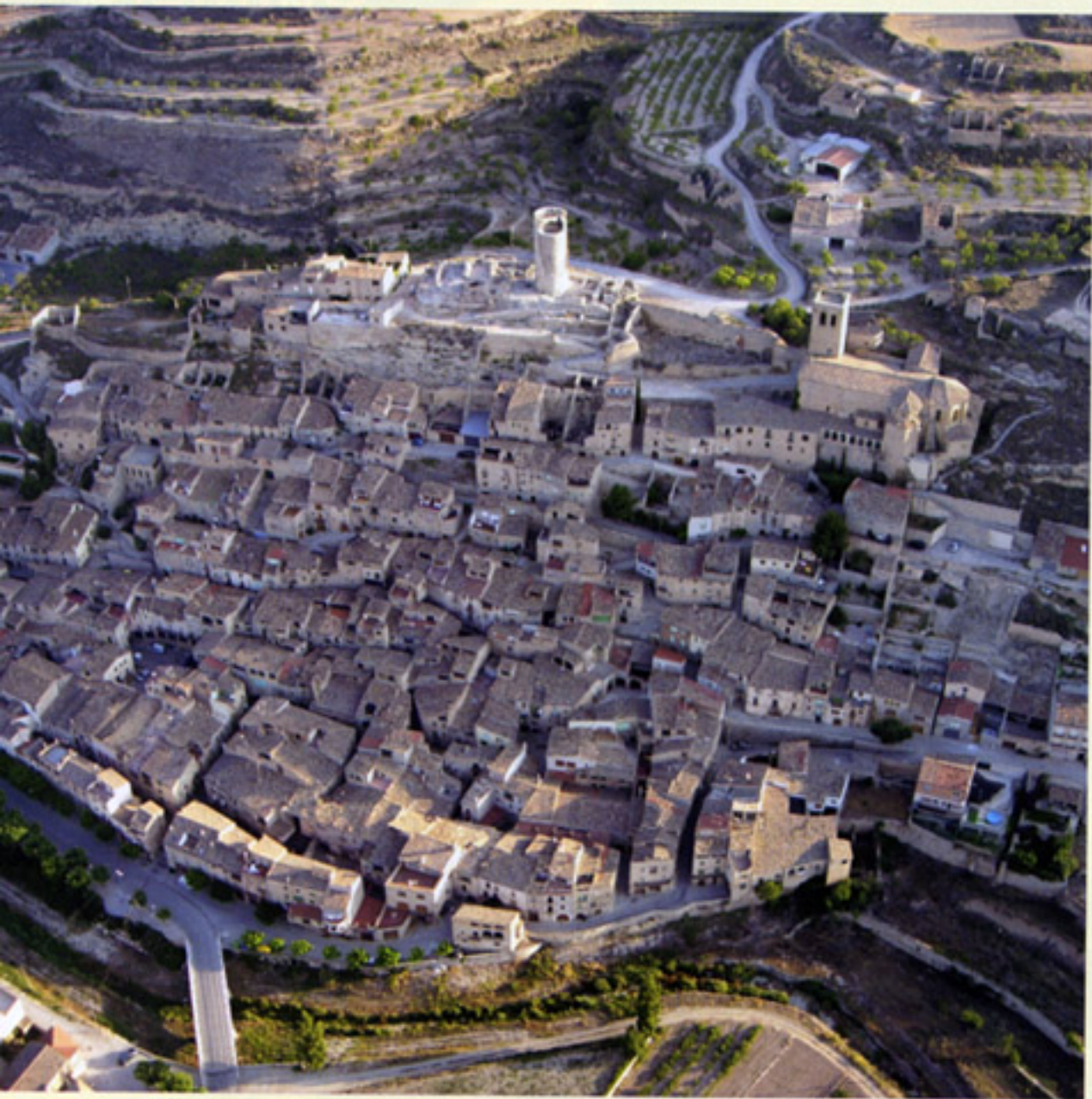
Sobre estas líneas, vista aérea de Guimerà. En la página anterior, fachada de Cal Manseta.

G uimerà es una villa, en principio, repleta de peculiaridades. Está situada en la ladera de un cerro, en la margen derecha del río Corb, a mitad de recorrido del mismo. A su vez, este cauce forma un paralelo que divide por la mitad Catalunya y el pueblo se encuentra en el centro mismo del término municipal. Todo un cúmulo de coincidencias en equilibrio que, sumadas a un bellissimo paisaje y un