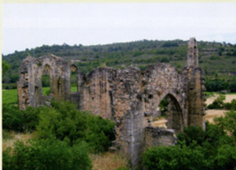
Arriba, ermita de La Bovera. Sobre estas líneas, las ruinas del Monasterio de Valisanta.

nos interesante es el Portal de Tàrrega, por donde se accedía al camino de la Bovera, Verdú y Tàrrega, y partir del cual se desarrolló el barrio del Raval.