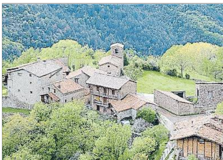
Cava, a l'Alt Urgell, amb 60 habitants, és un dels pobles vulnerables